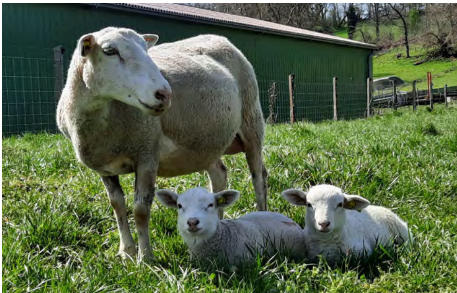
Les jeunes n'ont pas d'immunité face aux coccidies et au tænia alors que les adultes sont devenus résilients.

Du dernier traitement contre les parasites : date et produit utilisé.