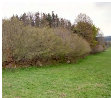
↑ Une haie de noisetiers avant coupe