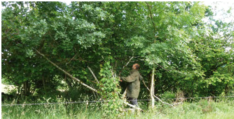
↑ Haie de noisetier en croissance « prête à être récoltée » dans le pays de Mauriac (bonne productivité)