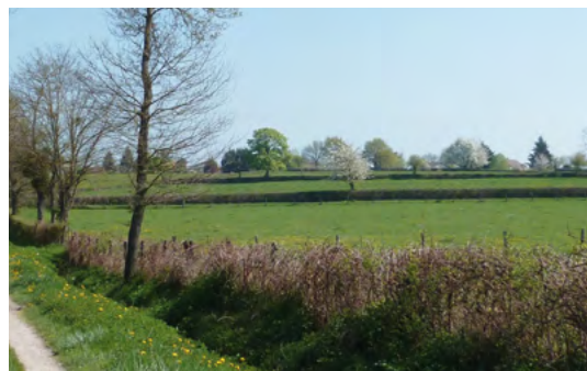
→ Haie basse taillée au carré annuellement dans l'Allier (productivité nulle)