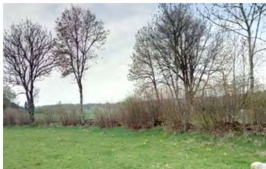
↑ Des repousses de noisetiers d'un an