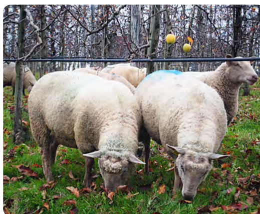
Le pâturage des vergers, vignes, céréales est testé sur 4 exploitations de lycées agricoles