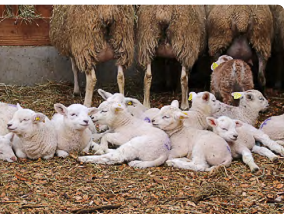
Une série de 12 essais sur le remplacement de la paille par des plaquettes de bois