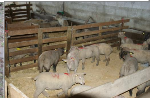
Deux essais sur litière de dolomie sont terminés