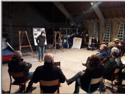
La journée pommiers à Saint Yrieix (87)