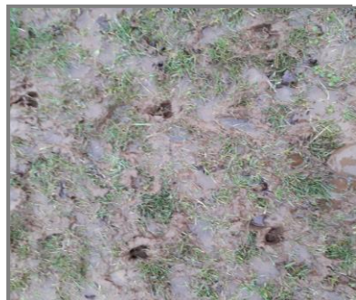
Des prés gorgés d'eau