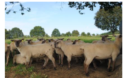
76 % de fertilité au lycée agricole de Bressuire avec 21 jours de lutte en automne