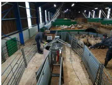
Les mesures d'imagerie 3D à InsemOvin et au Mourier