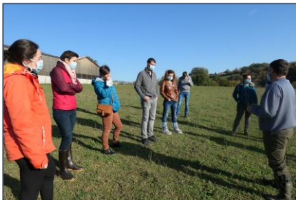
Le partage des connaissances et expériences sur les plantes à tanins