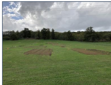
Rénovation des prairies : des mesures de rendement pendant 4 ans