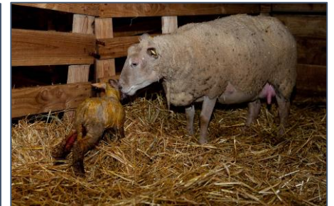
L'agnelage de près de la moitié des brebis de l'étude « bas carbone »