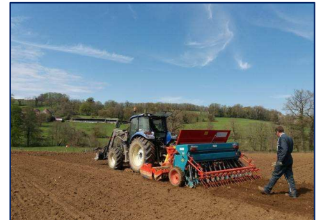
Le semis des miniparcelles de plantes à tannins