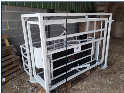
La cage pour tester l'autopésée