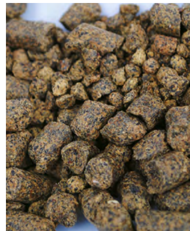
Le tourteau de colza peut constituer la seule source azotée de la ration.