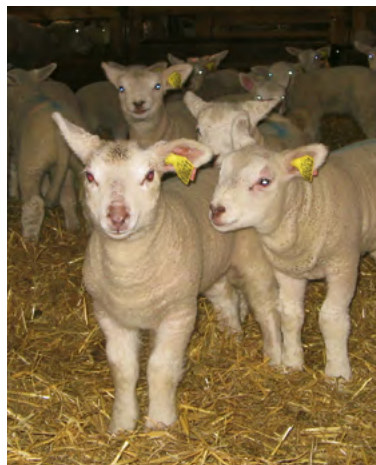
En équilibrant la ration, les croissances des agneaux sont équivalentes à celles obtenues avec les autres sources azotées.