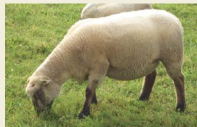
Note 4: brebis grasse

Les notes 0 et 5 sont peu utilisées: la note 0 correspond à une brebis cachexique.