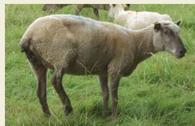
Note 1: brebis très maigre