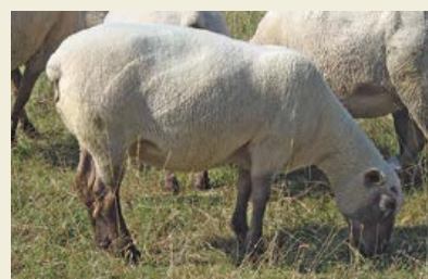
Note 3: brebis en état