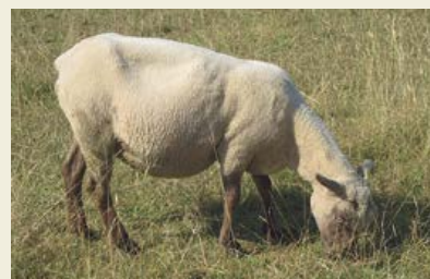
Note 2: brebis assez maigre