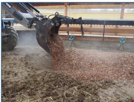
Les fumiers de plaquettes vont être épandus