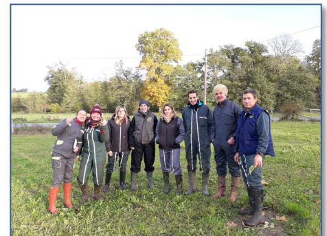
Les 7 stagiaires accompagnés de L Solas, l'un des formateurs