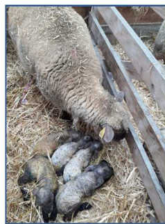
Deux portées de quintuplés chez des brebis Mouton Vendéen