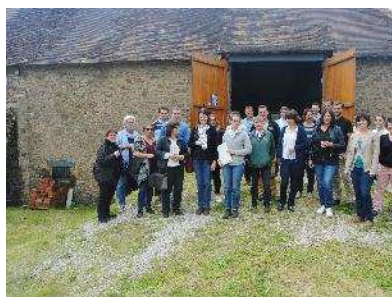
Le groupe de techniciens et d'enseignants présents le 20 juin