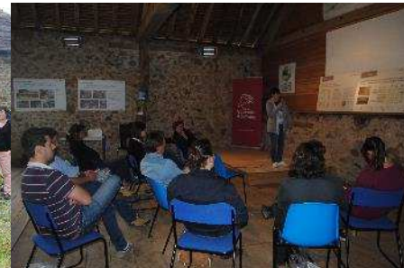
Un des 3 ateliers de l'après-midi