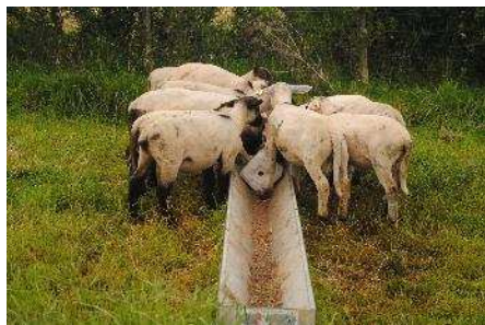
Des agneaux complétés avec des écorces de châtaigne