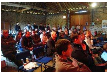
De nombreux partenaires présents à notre AG