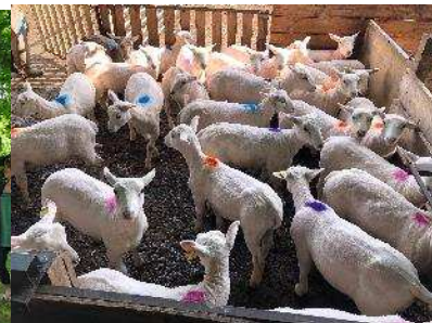
La mise en lots des agneaux pour l'essai pâturage des plantes à tannins