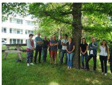
Les partenaires du projet CLIMAGROF