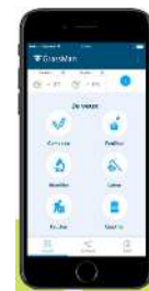
Une nouvelle appli pour aider à la gestion des prairies