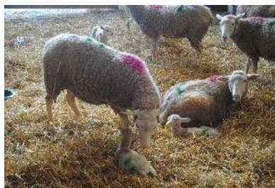
Des stages courts d'agnelage pour les futurs vétérinaires