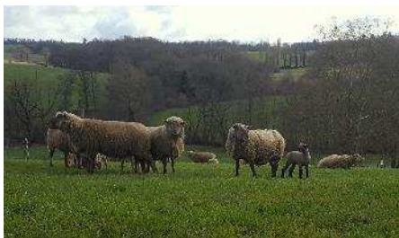
Les brebis allaitantes sont à l'herbe