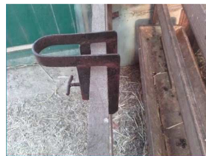
Le concours du Berger Futé de TechOvin est ouvert !