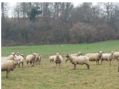
Les brebis en pâturage cellulaire