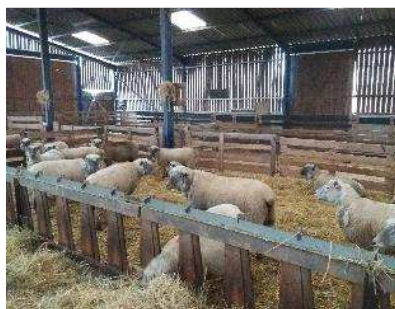
Leurs homologues rentrées en bergerie