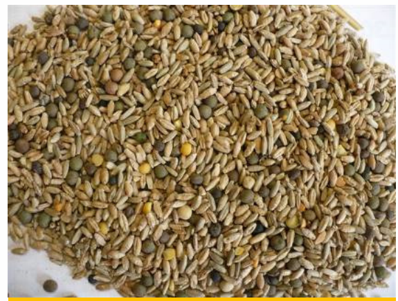
Mélange triticale seigle pois vesce, avec 25% de protéagineux