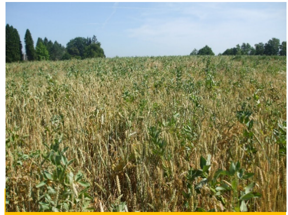
Seuls des mélanges complexes sont conseillés, plus stables qu'un mélange simple

On se cale sur la maturité des protéagineux pour déclencher le chantier, l'objectif étant de produire de la protéine. Le taux d'humidité à atteindre est de 15% pour un stockage optimum.