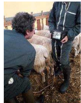
Le diagnostic de gestation des brebis