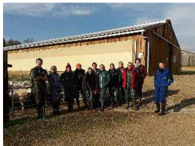
Les techniciens en formation au Mourier cette semaine