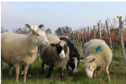
Le pâturage des vignes à Monbazillac