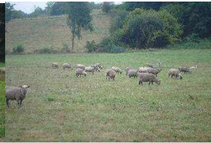
Les brebis en pâturage cellulaire