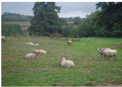
Les brebis en pâturage tournant