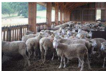
Les brebis prêtes pour l'IA sur plaquettes de bois