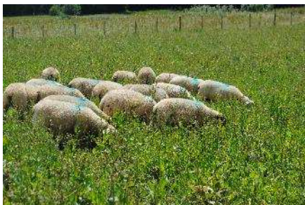
Les agneaux sur le mélange chicorée, plantain et lotier