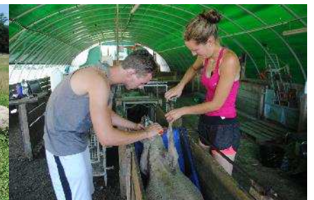
Le parage pour les brebis tarées