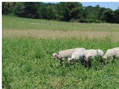
Les agneaux du pâturage cellulaire en finition sur un mélange avec de la luzerne