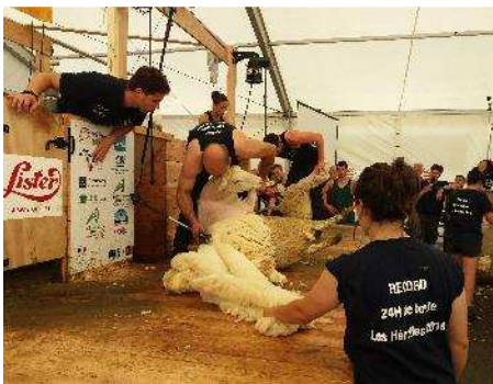
Les 24 heures de tonte aux Hérolles (86)