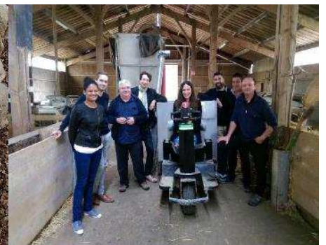
Le comité Digiferme® national en réunion au Mourier