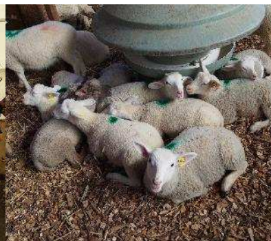
L'essai bois litière sur agneaux