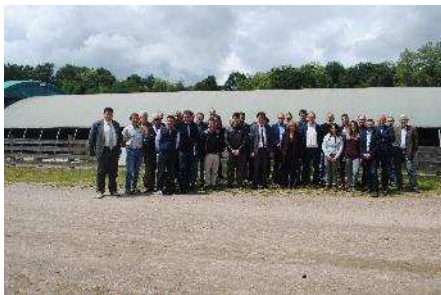
L'AG du CIIRPO le 29 mai