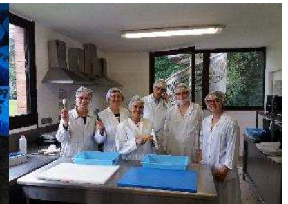
Les tests de consommateurs