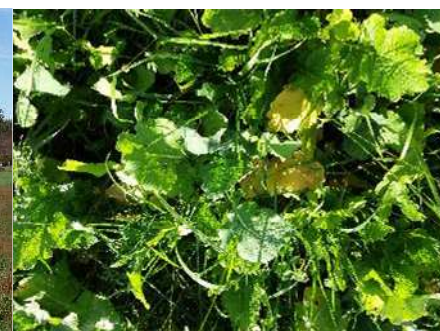
A Magnac Laval, les lots en essai en bergerie et à l'herbe et l'état de végétation des dérobées