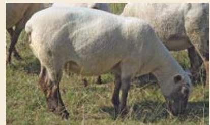
Note 3 : brebis en état