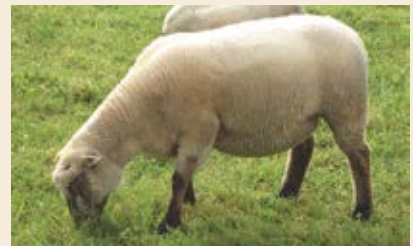
Note 4 : brebis grasse