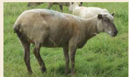
Note 1 : brebis très maigre

ÉTAT CORPOREL : UNE GRILLE DE NOTATION DE 0 À 5, DE TRÈS MAIGRE À TRÈS GRAS