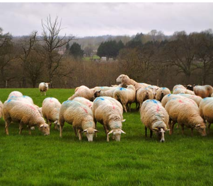
Les béliers doivent être au milieu des brebis. S'ils restent à part, c'est mauvais signe !

Réservées aux brebis adultes des races dites « désaisonnées », les luttes naturelles de contre saison présentent une particularité : ce sont les mâles qui déclenchent les ovulations. Les mises-bas sont ainsi décalées d'une quinzaine de jours.