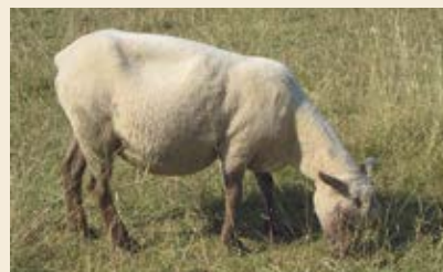
Note 2 : brebis assez maigre