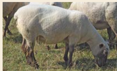
Note 3 : brebis en état