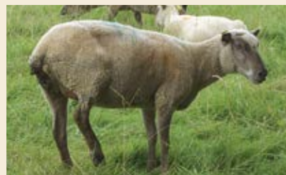
Note 1 : brebis très maigre

ÉTAT CORPOREL : UNE GRILLE DE NOTATION DE 0 À 5, DE TRÈS MAIGRE À TRÈS GRAS