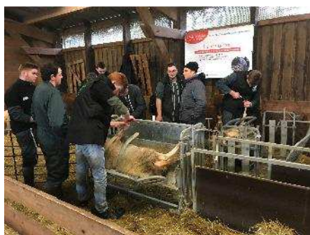
Les Ovinpiades à Ahun