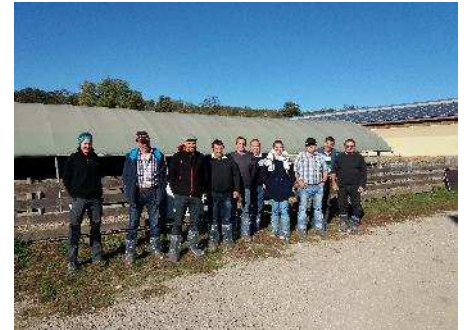
Des éleveurs de la Nièvre en visite au Mourier avec leur chambre d'agriculture