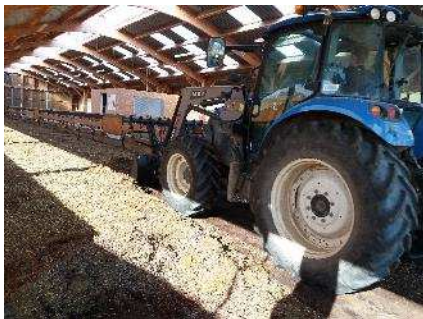
Le curage du fumier à base de plaquettes de bois