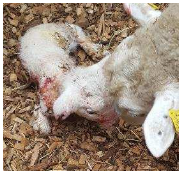
L'agnelage sur plaquettes de bois