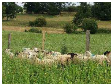
Les agneaux sur le mélange chicorée, plantin, lotier