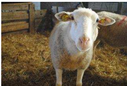
Une des brebis qui participe à l'étude avec le CHU de Limoges