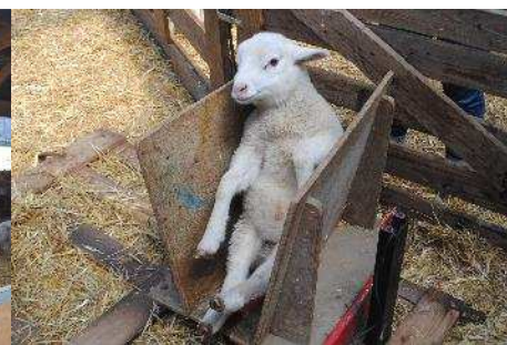
La pesée des agneaux en essai foin de luzerne