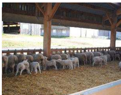
Les agneaux dans la bergerie FINA