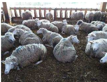
L'essai sur « bois litière »