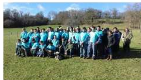
Les agneaux sevrés à Charolles Les brebis sur copeaux à Saint Flour La finale Limousine des Ovinpiades