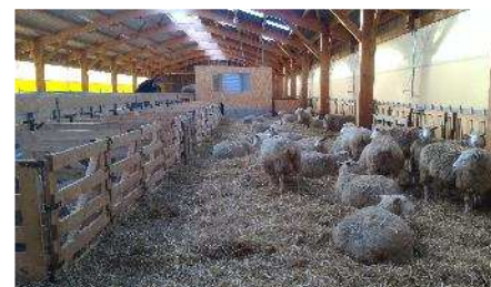
Les premiers agnelages ont eu lieu dans la bergerie FINA