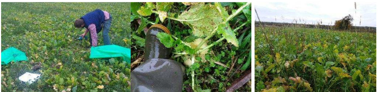
Les mesures réalisées sur les couverts végétaux à l'EPLEFPA de Montmorillon et de Limoges et du Nord Haute Vienne, sur le site de Magnac laval (deux photos de droite)