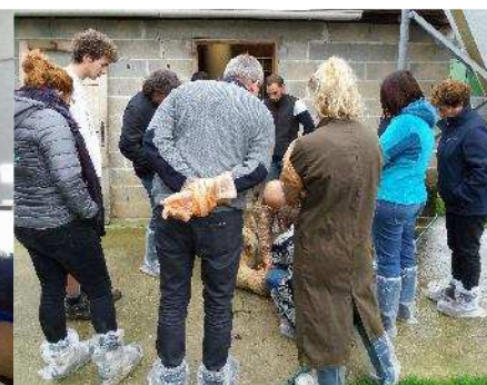
8 techniciens ovins en stage alimentation au Mourier