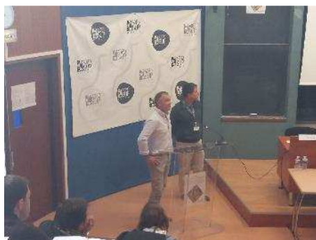
Les deux présentations lors du colloque polycultures élevage à Dijon