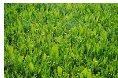
La parcelle « Alicament » à base de plantes à tanins