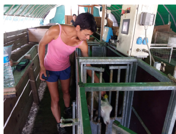
La pesée des agneaux pour mise en lots