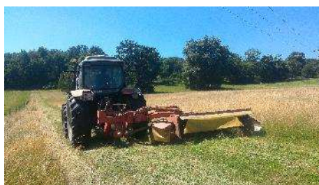
Les foins se terminent au Mourier