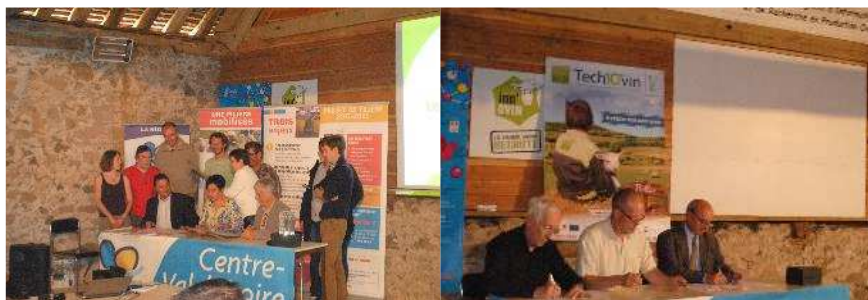
La signature du CAPOVIN de la région Centre Val de Loire et la signature de la Digiferm® ovine avec Idele, Arvalis et le CIIRPO