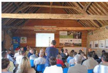
Nos partenaires et financeurs étaient présents à l'AG du CIIRPO