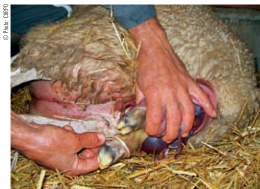
Pour tirer plus facilement sur les pattes, faire une boucle avec une cordelette, la remonter au-dessus des ergots puis tirer doucement.

Fiche réalisée par Delphine Daniel, vétérinaire formatrice.