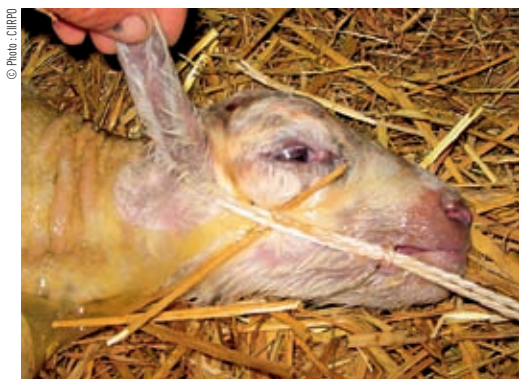
Si la tête est mal placée, bloquer la cordelette derrière les oreilles et dans la gueule de l'agneau.

Il faut alors essayer de sortir une patte et de la suivre pour trouver l'épaule puis la tête qui va avec. Repousser tout le reste qui appartient donc à un autre agneau. Ensuite corriger la position comme si l'agneau était seul. Poser des lacets peut éviter de « perdre » la patte ou la tête.