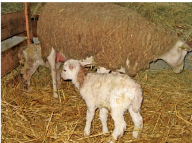
En présentation normale, les pattes avant et le museau arrivent en première position.

Une fois la décision prise : il faut se laver les mains, mettre des gants s'il y a eu des avortements ou si les pertes sont douteuses. Toujours faire preuve de douceur et de patience. Tant que le cordon est intact si la mère souffre, l'agneau souffre aussi. On ne gagne rien à vouloir aller trop vite.